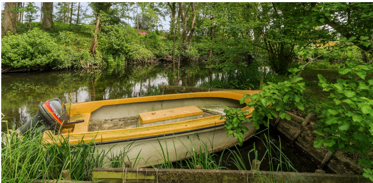
Billede af det nuværende bolværk med bro/”træplateau”.